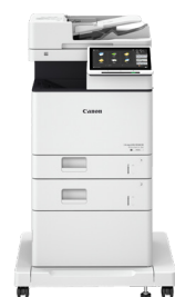
iR ADV DX 717/617/527