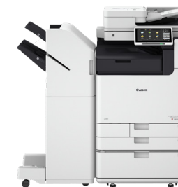
iR ADV DX C5800