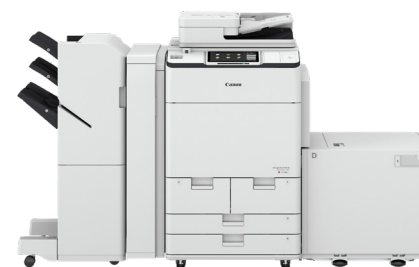
iR ADV DX C7700