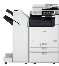
iR ADV DX 6800