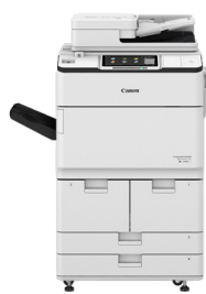
iR ADV DX 6780i